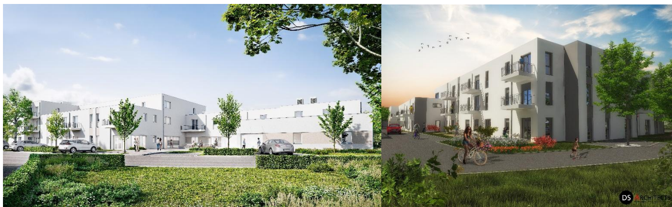
Beispielansichten: GBI Wohnungsbau GmbH