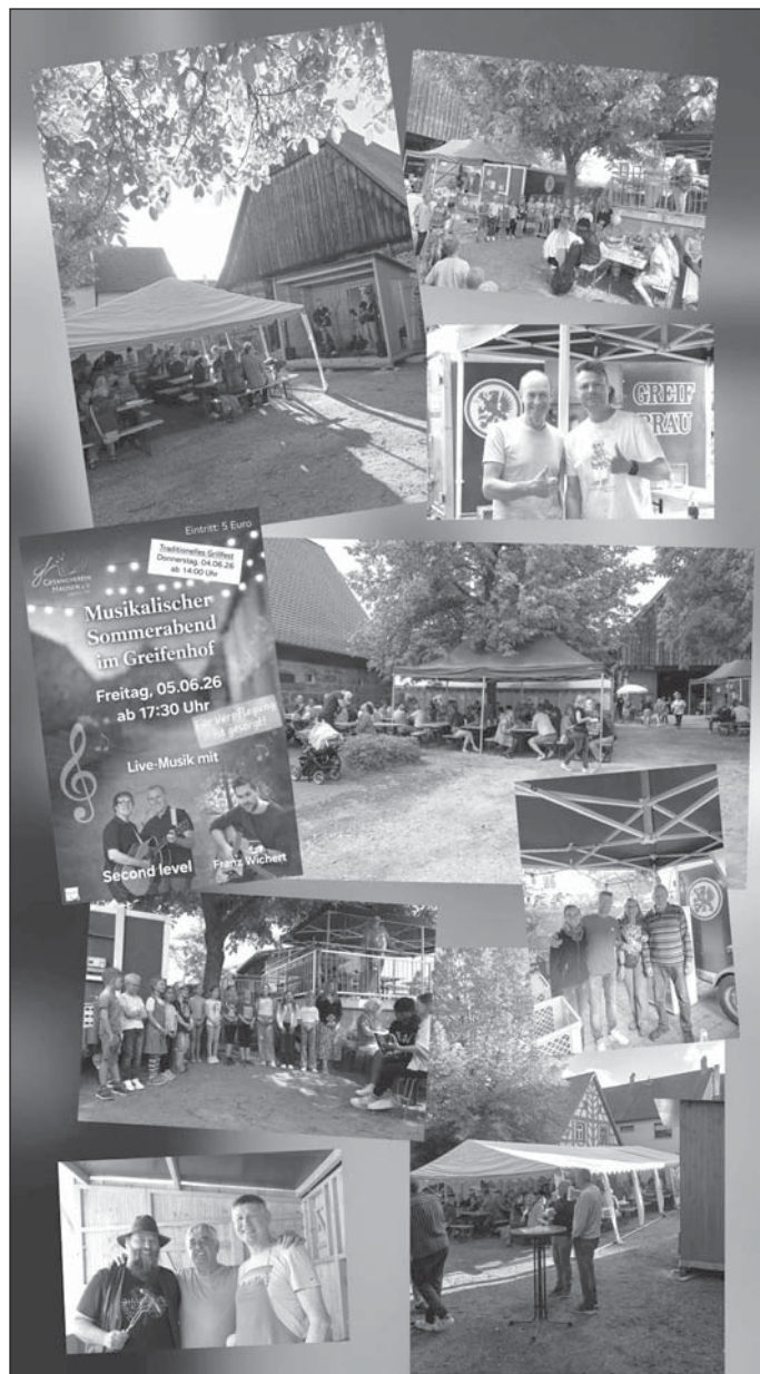
Musikalische Grüße, Gesangverein Hausen

Ein herzliches Dankeschön gilt allen Besucherinnen und Besuchern, die durch ihr Kommen unsere Veranstaltung und den Verein unterstützt haben. Ebenso danken wir allen Helfern, die mit ihrem Einsatz und guter Laune – sei es bei den Vorbereitungen, beim Kuchen backen, beim Auf- und Abbau, in der Küche, beim Ausschank oder im Service – zum Gelingen dieser beiden Feste beigetragen haben. Ohne so großes ehrenamtliches Engagement wären solche Veranstaltungen nicht möglich.